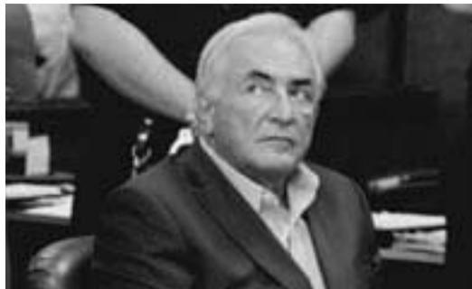
Förre IMF-chefen Dominique Strauss-Kahn.