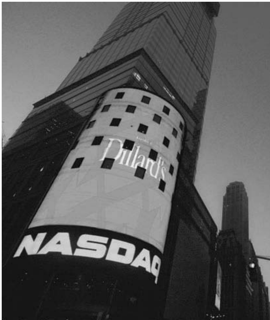
Svenskinspirerade mjukvaruföretaget Qliktech har gått som tåget sedan bolaget noterades på Nasdaqbörsen under förra sommaren. "Anledningen till att vi gick publikt, förutom att det var rätt plattform för att finansiera bolagets fortsatta tillväxt, var för att öka